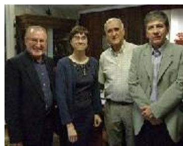
Visita a la Alcaldesa de Aranda de Duero