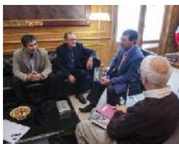
Visita al Presidente de la Diputación de Burgos

En el ámbito de las relaciones institucionales con las administraciones públicas, la FHN sigue manteniendo un estrecho vínculo de colaboración con las instituciones que colaboran con ella y al mismo tiempo abriendo otras nuevas. Así, en el mes de junio el Presidente de la Fundación visitó al Presidente de la Diputación de Burgos y a la Alcaldesa del Ayuntamiento de Aranda de Duero donde se reunió con los regidores de ambas instituciones con el objetivo de agradecerles el apoyo recibido plasmado en varias acciones de cooperación al desarrollo en Bolivia. En ambas visitas estuvo acompañado por el Director General del Proyecto Hombres Nuevos (contraparte boliviana), y responsables de la ONG soriana Tierra Sin Males que colabora con la Fundación.