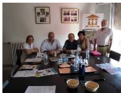
Visita a la Fundación Sociedad Protectora de los Niños

La actividad institucional de la FHN se refuerza con la promoción del trabajo en red . A las colaboraciones ya establecidas en años anteriores, hay que sumar entre otras: Comisión Justicia y Paz (Valladolid), la Fundación Emotiva (Palencia), Tierra Sin Males (Soria), la Fundación Ad Gentes (Valencia), Albergues Infantiles ALIN (León), y Arco Iris Educación para el Desarrollo (Oviedo). El viernes 19 de julio el Presidente de la Fundación visitó en su sede social de Madrid a los máximos responsables de la Fundación Sociedad Protectora de los Niños donde mantuvo un encuentro en el que les informó con detalle el desarrollo del proyecto Camino Nuevo con el que colaboran.