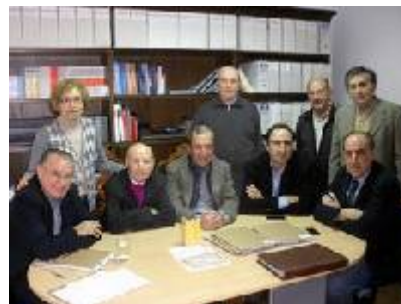
Patronato de la Fundación

La primera de las reuniones se celebró el domingo 9 de junio. Los principales acuerdos tomados por el Patronato fueron la aprobación del informe de gestión correspondiente al año anterior y de las cuentas anuales. En su intervención el Presidente hizo un balance de las actividades y de los proyectos de cooperación que se han realizado en Bolivia a lo largo del 2013.