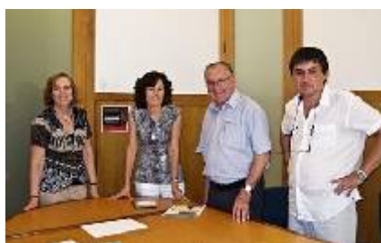
Visita a la Universidad de Alicante

La presencia institucional de la FHN se caracteriza por su participación en los principales órganos y consejos relacionados con su ámbito de trabajo, lo que le permite participar y contribuir en las decisiones relacionadas con la Cooperación Internacional para el Desarrollo. La FHN es miembro del Consejo Municipal de Cooperación de Palencia, y participa en la Unidad Territorial de ONGDs. Desde el mes de abril hemos entrado a formar parte de la Coordinadora de Organizaciones No Gubernamentales de Castilla y León (CONGDCYL), y participamos en todas las actividades y reuniones que organiza el Servicio de Cooperación de la Junta de Castilla y León.