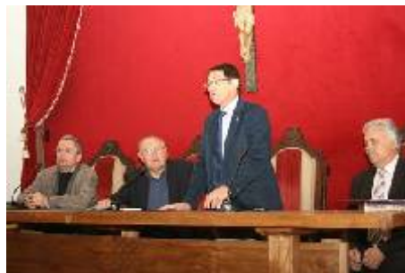
Firma del Convenio (San Isidoro de León)

En el mes de junio la Fundación ha suscrito un Convenio de Colaboración con la Muy Ilustre, Real e Imperial Cofradía del Milagroso Pendón de San Isidoro (León).