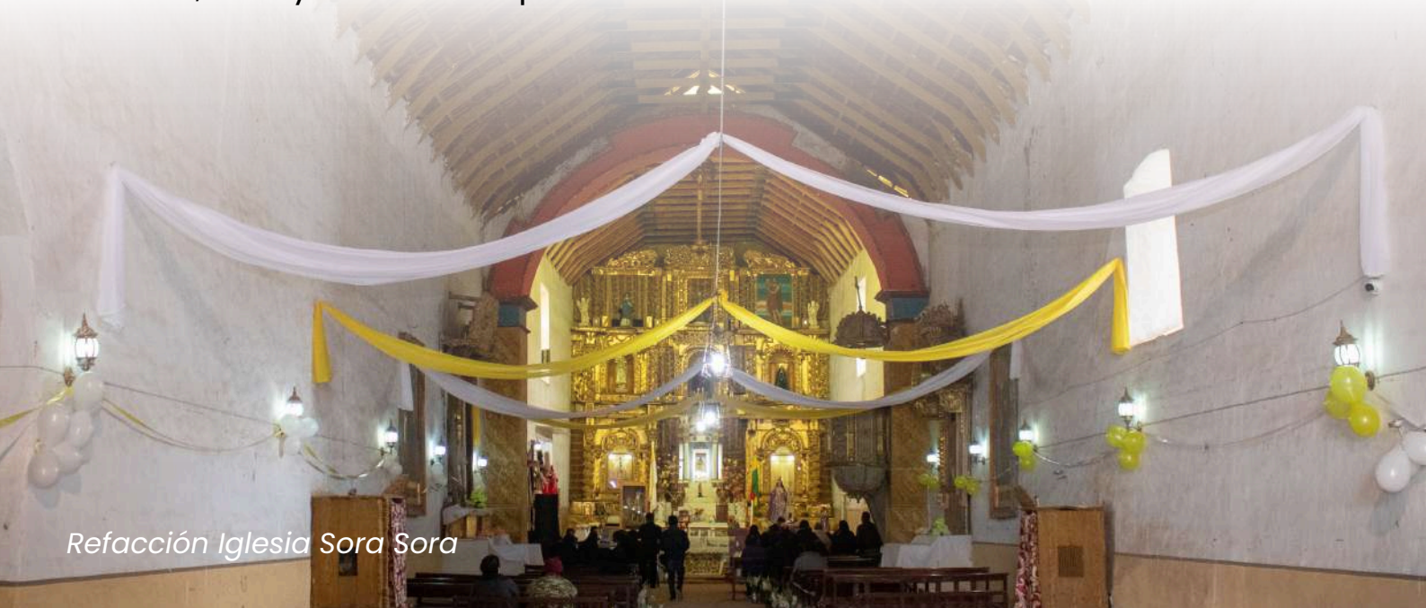
Refacción Iglesia Sora Sora

La Fraternidad, el Proyecto y la Fundación Hombres Nuevos, profundamente agradecidos con la acogida del Cardenal Julio Terrazas y la Arquidiócesis de Santa Cruz, han trabajado en comunión durante décadas. Su fundador, tras 23 años como párroco solidario, promovió la llegada de sacerdotes misioneros y lideró significativas contribuciones económicas para la construcción de iglesias, locales parroquiales y el Seminario Mayor San Lorenzo, incluyendo becas para seminaristas.