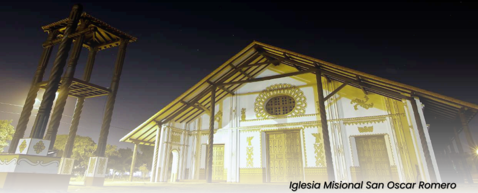
Iglesia Misional San Oscar Romero y Santa Monica