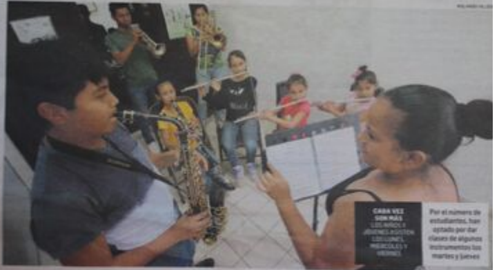
CABA VEZ CON MÁS LOS NIÑOS Y JUVENES DE LOS DISTRICTOS DE LOS YACAJES Y YACAJES