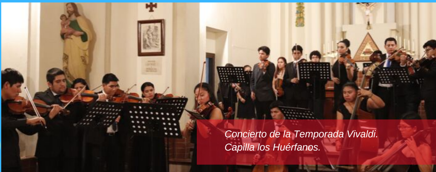
Concierto de la Temporada Vivaldi. Capilla los Huérfanos.