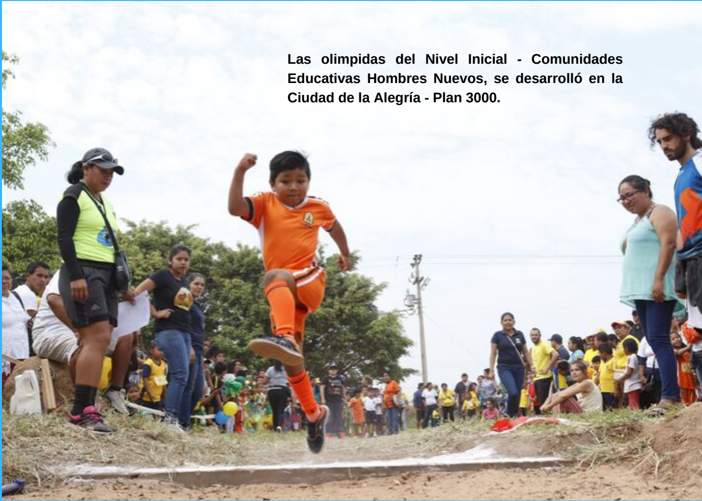
Las olimpidas del Nivel Inicial - Comunidades Educativas Hombres Nuevos, se desarrolló en la Ciudad de la Alegría - Plan 3000.