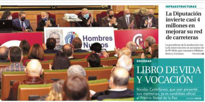
Diario: El Norte de Castilla Palencia, 5 de noviembre de 2021

El 4 de noviembre, se realizó la presentación del libro Memorias: Vida, pensamiento e historia de un obispo del Concilio Vaticano II en Palencia, España. Se contó con la presencia de amigos de la Fundación Hombres Nuevos de España.