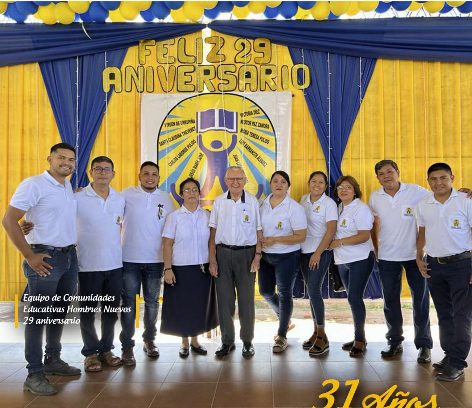
Equipo de Comunidades Educativas Hombres Nuevos 29 aniversario