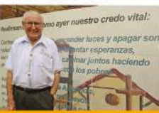
...como ayer nuestro credo vital: '...vender luces y apagar son...'. Hombres Nuevos siempre con los pobres.

Una señal de esperanza del Plan 3000 es el Proyecto Hombres Nuevos. Es la acción de la ciudad. Andrés Bello Hombres Nuevos ha comenzado la escuela en el barrio marginal de Plan 3000 y con la Universidad Católica construye y gestiona la Unidad Educativa de Teodoro de Betancourt.